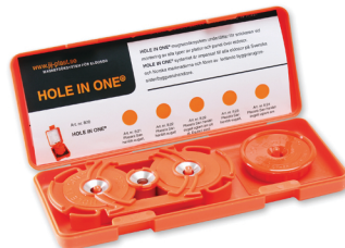
Art. nr. 2004 Sats för dubbeldosa