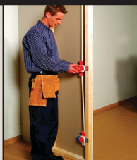
Placera HOLE IN ONE insatsen i eldosan.