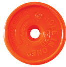
Art. nr. 8:21 Sökare