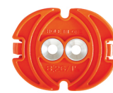
Art. nr. 8:26 Dosinsats för apparatdosa 1 1/2. Håldiameter i vägg ca 75 mm x 2 överlappande