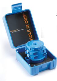
Art. nr. 800N HOLE IN ONE®