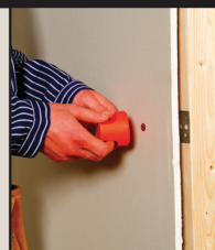
Sök upp den dolda insatsen med HOLE IN ONE sökare 8:21 eller Supersökare 2000 och märk ut centrum.