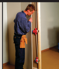
Montera gipsplattan / panelen.