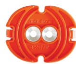
Art. nr. 8:26 Dosinsats för apparatdosa 1 1/2. Håldiameter i vägg ca 75 mm x 2 överlappande