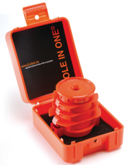
Art. nr. 800 HOLE IN ONE®

Följande HOLE IN ONE® produkter finns i din världsorterade butik. Ingående artiklar kan även köpas separat.