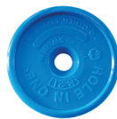
Art. nr. 8:21N Sökare