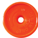
Art. nr. 8:21 Sökare