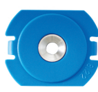
Art. nr. 8:22N Insats för apparatdosa. Håldiameter i vägg ca 75 mm