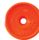
Art. nr. 8:21 Sökare