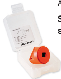
Art. nr. 2000 Supersökare med stämpelmarkör