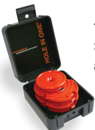
Art. nr. 2005 Sats för apparatdosa 1 1/2